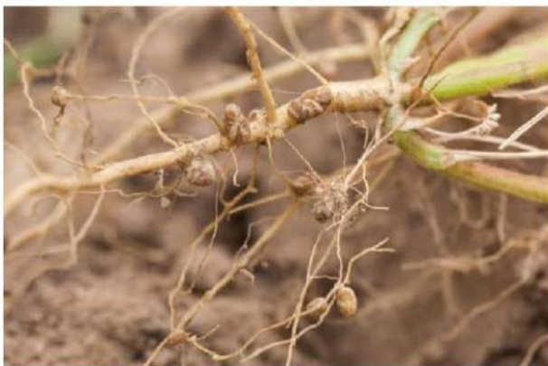
شکل ۱. گره های حاصل از همزیستی باکتری و سویا

شکل، رنگ ناف و پوسته بذر با هم متفاوتند. بذور سویا عموماً بیضی هستند.